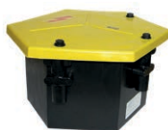
Point heating connection box Tipo 6400