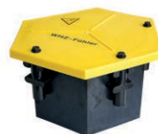
Elemento collegamento riscaldamento scambi Tipo 6400